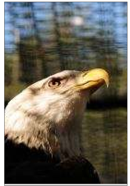
Por: Laura Lucio

Para concluir, existen varios mecanismos legislativos cuya única función es proteger la armonía que existe entre el hombre y el ambiente. La SEMARNAT, en conjunto con otras Instituciones y Secretarías, presentan un carácter preventivo. Junto con la LGEEPA y estas Secretarías e Instituciones se trata de regular de manera consiente la utilización y explotación de los recursos naturales.